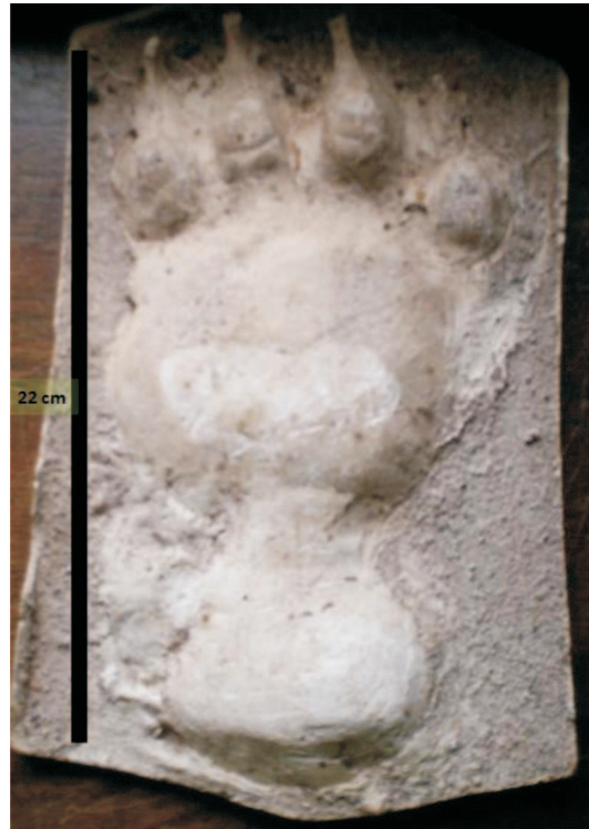
Fig. 4. Detalle del molde en yeso, de la huella del pié izquierdo de un ejemplar adulto, levantada por A. Canedi, el 25 de junio de 1993 en el departamento Ledesma (Jujuy) (véase explicación en el texto).

tanto que el más reciente corresponde a marcas en árboles en un sendero de actividad obtenido durante enero de 2006, en el departamento de Orán (Fig. 2).