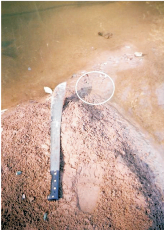
Fig. 3. Impresiones de pié y mano, en sustrato arenarcilloso, según fotografía obtenida el 30 de julio de 2004 en el departamento de Orán (Salta). Obsérvese el pié en la mitad inferior de la imagen, junto al machete, aunque la impresión de la mano (óvalo blanco) es difícil de distinguir (véase explicación en el texto).