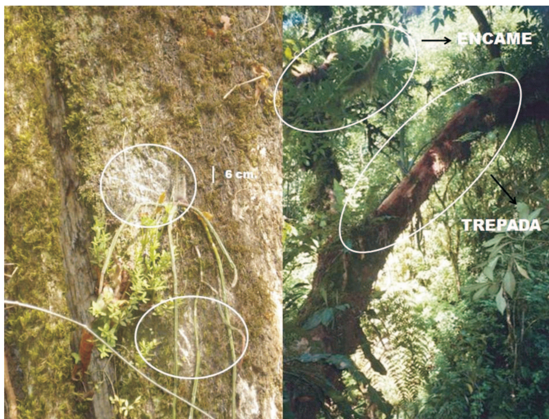
Fig. 2. Rasguños y trepado de oso, con un encame en tronco de Phoebe porphyria , en el departamento de Orán (Salta), según una fotografía obtenida en enero de 2006, a 904 m s.n.m. En los círculos de la fotografía de la izquierda, son visibles los rasguños. Nótese en el margen superior, la marca de los 5 dedos característicos de la especie.

madereros, etc.). En los casos de avistamientos directos, en ausencia de otras pruebas, se presume que los reportes comunicados por los informantes son confiables.