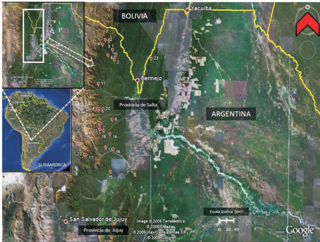
Fig. 1. Mapa de ubicación del área de estudio, con localización geográfica de los registros de Tremarctos ornatus , en las provincias de Salta y Jujuy, noroeste de Argentina, según datos obtenidos entre 2001 a 2006. Cada globo, representa un registro.

se distribuye desde el occidente venezolano por Colombia, Ecuador, Perú y la vertiente oriental de los andes bolivianos hasta el centro del departamento de Tarija, vecino con el límite noroccidental de Argentina. En un rango altitudinal desde los 250 a 4.250 m s.n.m. (Mondolfi, 1971; Peyton, 1999; Azurduy, 2000; Goldstein et al. , 2008). Se lo ha incluido en el Apéndice I de CITES desde 1977 (CITES, 2005), y clasificado por la Unión Internacional para la Conservación de la Naturaleza (IUCN) como Vulnerable a nivel mundial (Goldstein et al. , 2008). La aparición actual del oso en esta zona ha sido considerada remota, debido a que se extinguió presuntamente hace 200 años atrás (Brown & Grau, 1993; Parera, 2002). Sin embargo, anteriormente se había especulado como probable que permanecieran aún unos pocos ejemplares aislados (Brown & Rumiz, 1989; Peyton, 1999), persistiendo todavía mucha información contradictoria, al respecto. Actualmente, muchos expertos no creen que la distribución de esta especie se extienda a